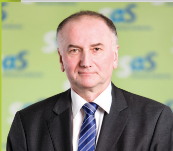
ING. EUGEN JURZYCA

je rešpektovaným odborníkom na dane, odvody a pracovné právo, ako lektor odškolí každý rok okolo 5 000 ľudí. Vo svojej práci sa riadi heslom „je lepšie naučiť hladných ryby chytať, ako ich nimi iba kŕmiť“. V rokoch 2005 – 2006 pôsobil ako externý poradca ministra zdravotníctva v oblasti zdravotného poistenia. V rokoch 2010 – 2011 bol ministrom práce, sociálnych vecí a rodiny. Je spoluautor internetových poradenských portálov www.drak.porada.sk a www.mzdy.tv . Študoval na Matematicko – fyzikálnej fakulte Univerzity Komenského. Medzi jeho záľuby patrí futbal, je prezidentom občianskeho združenia futbalového klubu Inter Bratislava, ktorý sa mu spolu s ďalšími nadšencami podarilo zachrániť. Je podpredsedom strany a poslancom NR SR.