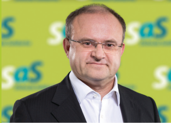
RNDR. JOZEF MIHÁL

vyštudoval teoretickú kybernetiku, matematickú informatiku a teóriu systémov na Matematicko-fyzikálnej fakulte Univerzity Komenského v Bratislave. Po štúdiách pracoval najprv ako programátor a neskôr ako programátor-analytik. Potom podnikal v oblasti veľkoobchodu, maloobchodu a tvorbe softvérových aplikácií. Neskôr zastával manažérske pozície vo viacerých medzinárodných aj slovenských spoločnostiach pôsobiach v oblasti veľkoobchodu a maloobchodu. Vo vláde Ivety Radičovej bol ministrom obrany SR. Skúsenosti z transparentnosti v privátnom sektore zúročil aj na rezorte obrany, v minulosti známom neefektívnym obstarávaním a riadením, na ktorom zaviedol a nastavil čisté finančné toky a manažérske riadenie. Od roku 2011 je poslancom Národnej rady SR, členom Výboru pre obranu a bezpečnosť a členom Osobitného kontrolného výboru na kontrolu činnosti Vojenského spravodajstva. Okrem problematiky vonkajšej a vnútornej bezpečnosti sa venuje aj oblasti transparentnosti a boju proti korupcii. Je podpredsedom strany a poslancom NR SR.