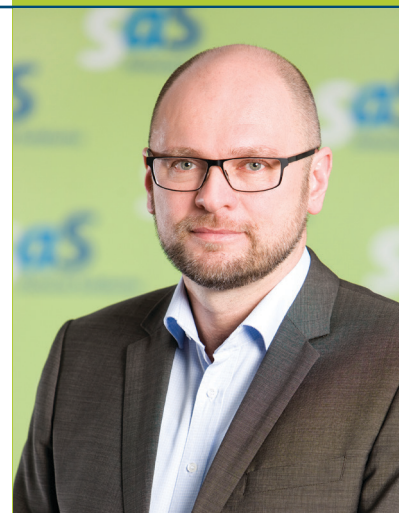
Richard Sulík predseda strany SaS

Na to potrebujeme váš hlas, o ktorý sa týmto uchádzame. Mandát, ktorý nám dáte, budeme vykonávať čestne a zodpovedne. Sľubujem.