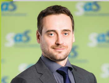
JOZEF RAJTÁR, DIP MGMT

je poslancom NR SR a tímlídom strany SaS pre verejné financie. Bol ministrom školstva vo vláde Ivety Radičovej. Vyštudoval Vysokú školu ekonomickú a absolvoval polročný študijný pobyt na Georgetown University (1993), Je zakladateľom inštitútov INEKO, Transparency International Slovakia a Podnikateľskej aliancie Slovenska. Bol riaditeľom INEKO, členom Bankovej rady Národnej banky Slovenska a podpredsedom a členom Rady Protimonopolného úradu. Je nositeľom najvyššieho štátneho vyznamenania Radu Ľudovíta Štúra II. triedy, nositeľom Krištáľového krídla a v roku 1999 bol vybraný nositeľom Nobelovej ceny Profesorom Ronaldom Coaseom pre účasť na výročnej konferencii International Society for New Institutional Economics. Mnohokrát bol vyslaný na zahraničné konferencie týkajúce sa najmä hospodárskeho rozvoja ako konzultant OECD, Svetovej banky a iných organizácií. Je ženatý a má dvoch synov.